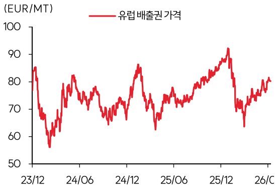
유럽 배출권 가격 추이