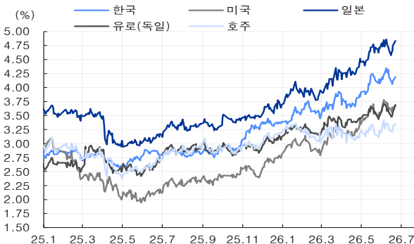
그림 2. 국내투자자 기준 환헤지 감안할 경우의 국제 투자유인

장기투자자에게 채권의 표면이자율 차이는 환헤지 프리미엄으로 상쇄된다. 최근 빠르게 높아진 일본국채 만기보유 투자유인은 연기금/보험사와 같은 장기투자자 머니무브와 맞물리면서 수급 상 위험요인으로 작용할 수 있다(그림 2). 환헤지 프리미엄을 조정하면 상단이 열리는 구조다. 물론, 헤지포지션은 롤오버를 반복하기 때문에 영원한 프리미엄은 없다. 그럼에도 일본으로 자금을 되감는 것(엔캐리 청산)과는 다른 맥락으로 전개될 전망이다. 자국자본이 회귀하는 것과 해외자본이 자국으로 유(출)입되는 것은 다르기 때문이다. 후자의 경우, 통제하기 힘들다. 우리나라는 어떨까. 성장과 긴밀한 매크로 지표가 폭발하고 있다. 현재 유의한 추세가 가능한 것에 집중하면, 2026년 하반기 韓채권시장의 화두는 인플레이션과 분배일 것이다.