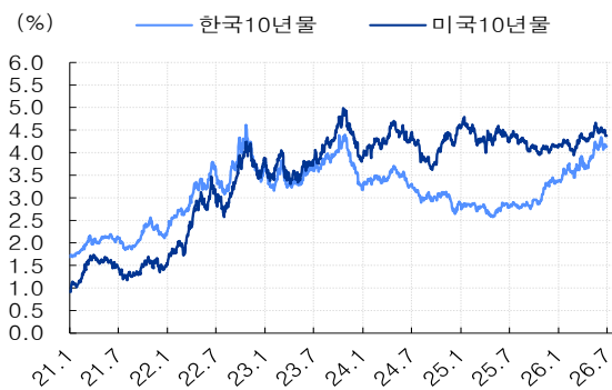
그림 1. 韓기간프리미엄 빠른 확대로 장기구간 한미금리차 축소

한국은행은 통화정책 기조를 긴축적으로 전환했다. 2026년 하반기 기준금리 인상이 본격적으로 전개되면, 경제전반의 조달환경은 한층 조여질 것이다. 이는 현재 주어진 정보이기 때문에 크레딧 시장이 선반영하며 초단기물 차환우려로 번지고 있다(중앙그룹 사태). 시장금리가 상승하면서 한미 금리차는 좁혀졌으나, 폭발적이 매크로 지표에도 원달러 환율은 여전히 고공행진이다. 돈은 어디로 흐르고 있을까. 韓주가지수 150배, 50배 레버리지 상품에 역외거래소에 출시됐다. 스테이블 코인, AI혁신Machine to Machine과 연계하면서 새어 나갈 지점은 없을까. 예상보다 빠르게 새어 나가는 경우 소비권 신용위험으로 이어질 수 있는데, 이러한 가격결정은 물리적 위치와 독립적으로 24시간 거래되면서, 마찰비용이 낮고, 자본의 유출입이 자유로운 곳에서 효율적으로 진행될 것이다.