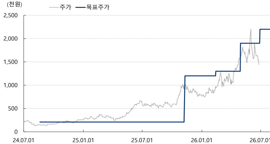
두산 최근 2년간 목표주가 변동추이