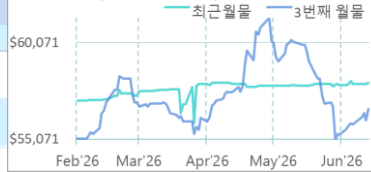
LME Cobalt (Fastmarket MB)