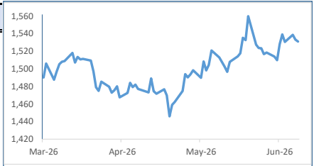
[달러/원 환율 추이(3개월)]

* [달러/원(NDF) 종가 - 스왑포인트(-85전)] - 달러/원(서울) 종가