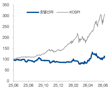
최근 12개월 주가수익률