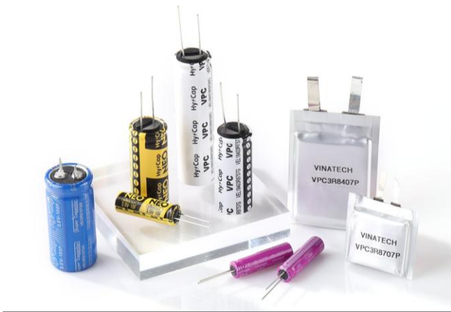
자료: 비나텍, 삼성증권