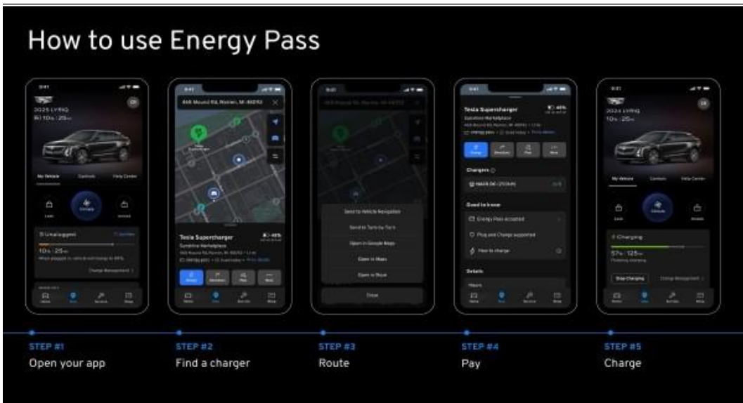
자료: GM, 삼성증권