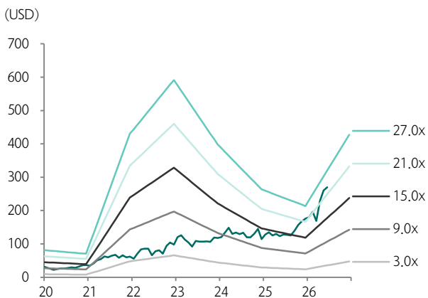
도표 2. 스틸다이나믹스 PER밴드