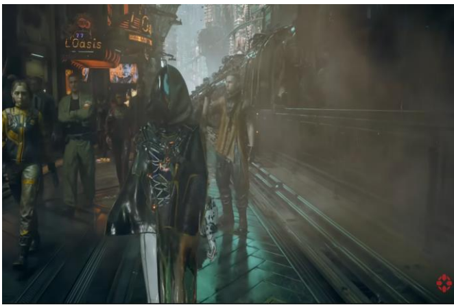
도표 2. 스텔라 블레이드: 블러드 레인