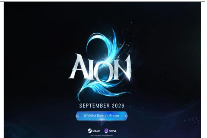
도표 3. 아이온2 글로벌 9월 출시 확정