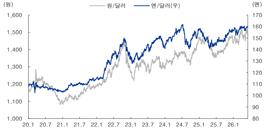
그림 3. 대규모 대미 투자 약정 등도 은연중에 환율을 압박하는 요인 ▶ 우리나라나 일본, 대만 등의 공통점은 양호한 펀더멘탈에도 불구하고 대미수출의존도가 크고 미국과 대규모 투자 약정은 맺었다는 점. 그리고 달러 대미 절하 폭이 큰 나라들임