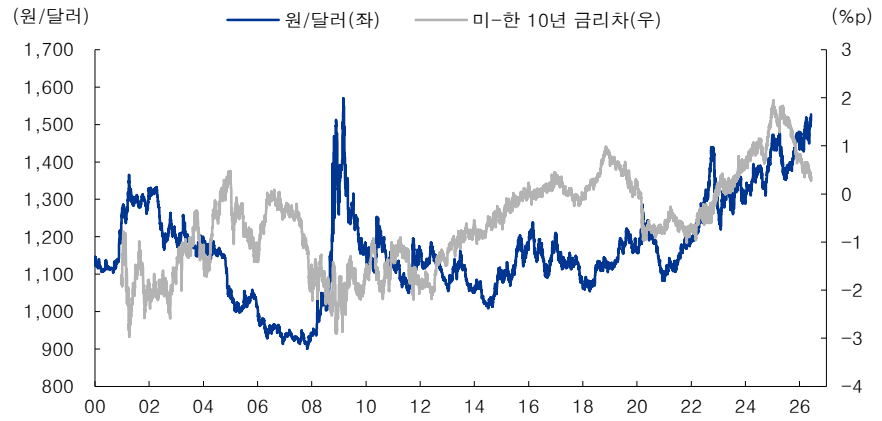
그림 1. 미국과의 금리차가 크게 좁혀졌음에도 불구하고 환율 가파르게 상승 → 중동 사태에 따른 유가 급등 등 다른 요인들이 상승 요인으로 등장