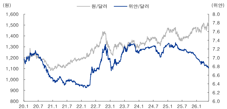
그림 4. 반면, 우리 원화와 연동성이 높았던 중국 위안화는 미국의 투자 압박이 거셌던 지난해 하반기 이후 원화나 일본 엔화와는 다른 방향으로 움직임