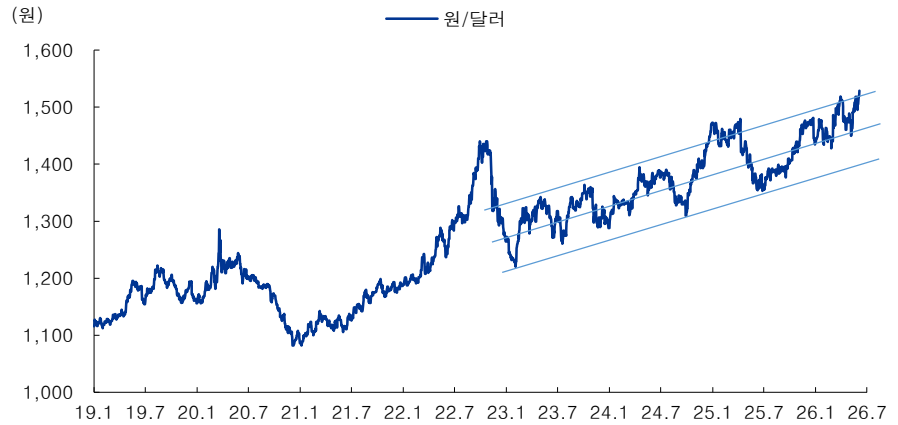
그림 5. 단기적으로 원/달러 환율은 추세대 상단에 도달 ▶ 추가 급등보다는 반락 가능성 더 있어 보임. 하지만 추세대 자체는 저점을 계속 높여가며 여전히 견고한 상황 추세대가 유지되고 있음