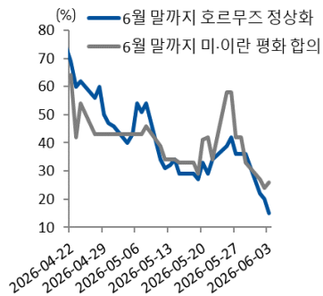
< 베팅사이트에 반영된 기대감 >