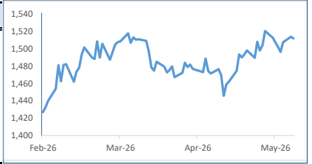
[달러/원 환율 추이(3개월)]

* [달러/원(NDF) 종가 - 스왑포인트(-110전)] - 달러/원(서울) 종가